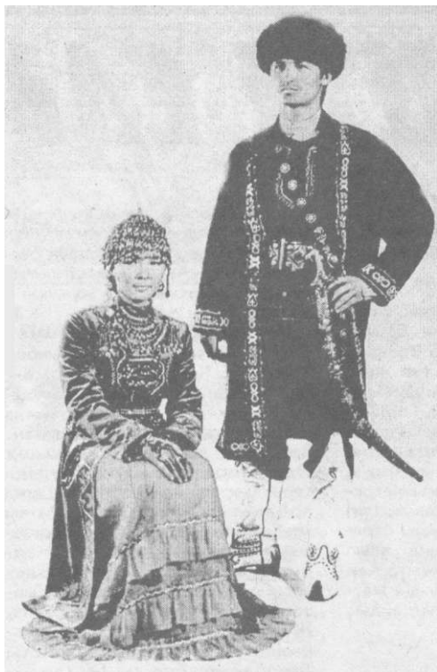
(Соңы Басы газетіміздің өткенсандарында).

Қазақ руға бөлінетін халық. Қазақ деген елдің негізгі құрамы өз таңбасы, өз ұраны бар көшпелі рулардан құралған. Қазақ рулары тарихи-этнографиялық тұрғыдан бірсыпыра зерттелді деп айтуға болады. Оған соңғы кезде көп жариялана бастаған шежірелер де куә. Сонымен қатар қазақ ішінде төре, қожа, төлеңгіт, сунақ, келеген сияқты көптеген әлеуметтік-этнографиялық топтар да бар. Дәм жазса, болашақта біз олар туралы жеке әңгіме айтамыз. Ал қазіргі әңгімеміз қалмақ руы жөнінде.