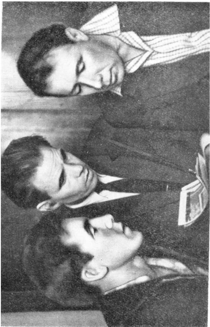
Члены фотоклуба Дворца культуры горняков.

В программу работы кружка входят встречи с профессиональными мастерами кисти, разбор экспонируемых на выставках полотен побывавших в Караганде московских, ленинградских художников, путешествия с блокнотом и карандашом по родному краю, изучение творчества классиков живописи.