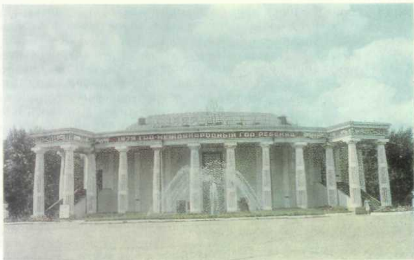
Караганда. Летний театр