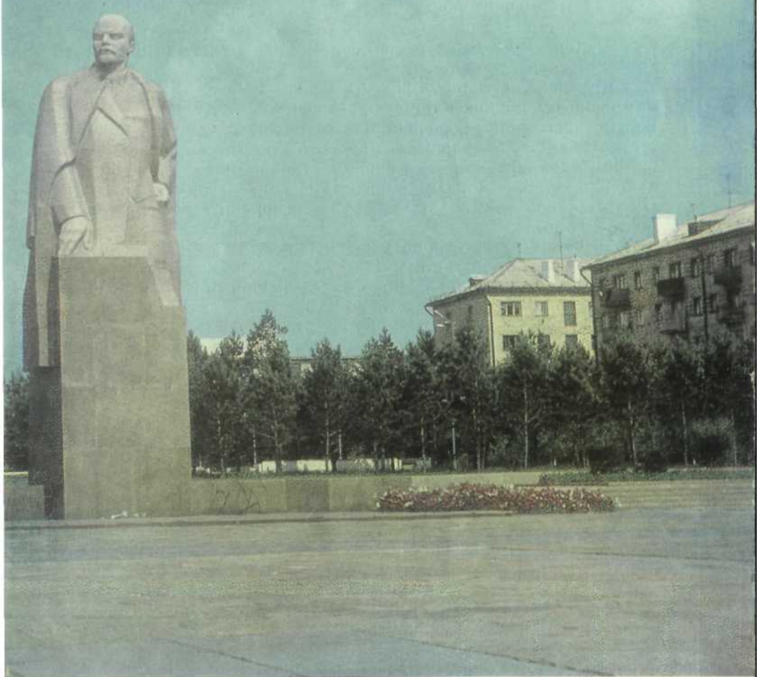
Караганда. Памятник В. И. Ленину

«Да, богатый у вас край, большие возможности,—говорил Владимир Ильич Ленин в беседе с казахстанцами, делегатами седьмого Всероссийского съезда Советов.—Надо поднимать этот край. И, безусловно, будем поднимать и поднимем. В народе таятся огромные силы».