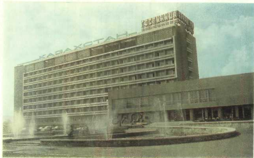
Караганда. Гостиница «Казахстан»