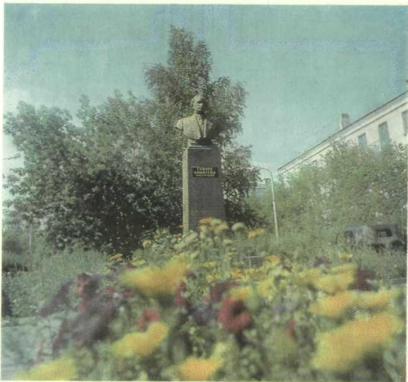
Темиртау. Бюст Георгия Димитрова