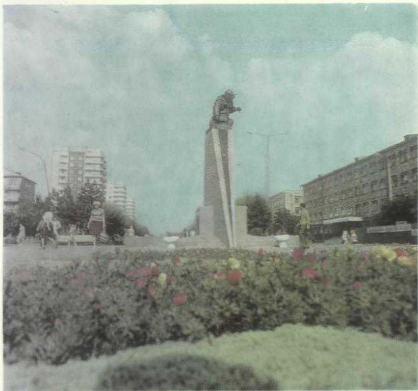
Караганда. Памятник Герою Советского Союза Н. Абдирову, повторившему подвиг Н. Гастелло

тов, для советского народа. Решением Президиума ВСНХ СССР был образован трест «Карагандастройуголь». Его задачей стало строительство и эксплуатация шахт. Возглавил трест опытный специалист Корней Осипович Горбачев.