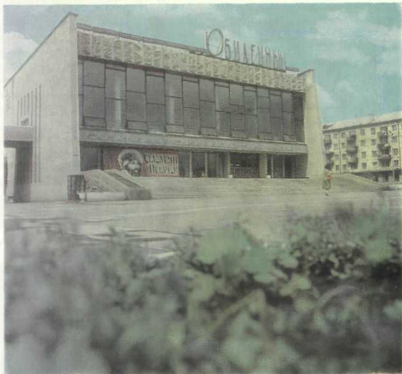
Караганда. Кинотеатр «Юбилейный»

земления на карагандинской земле, 18 космонавтов. Герои космоса — Почетные граждане города. Их именами названы улицы и площади. Карагандинцы чувствуют себя причастными к историческим подвигам во Вселенной и по праву этим гордятся.