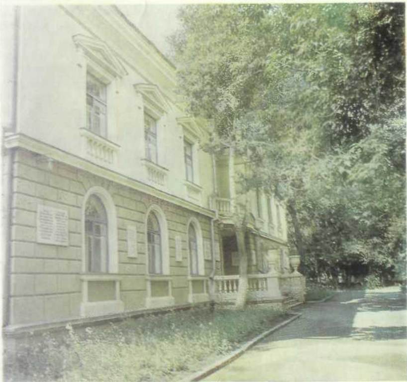
Гостиница «Чайка». Здесь отдыхали после полета многие космонавты