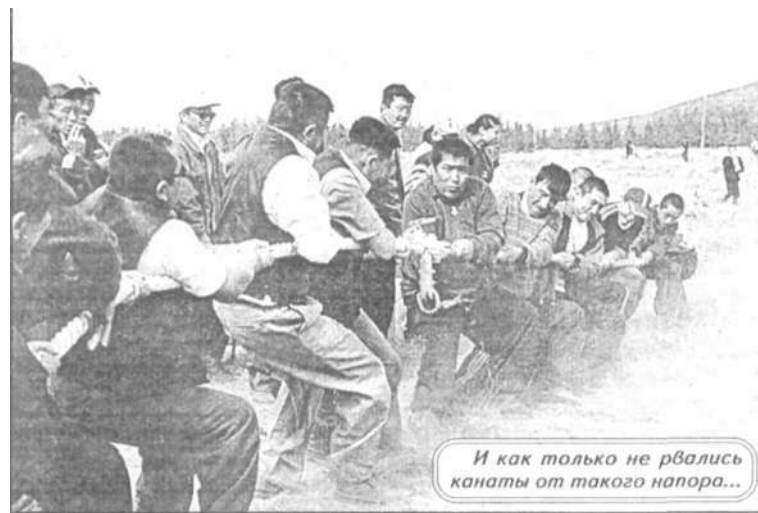
И как только не рвались канаты от такого напора...

В СОВЕТСКИЕ ВРЕМЕНА этот совхоз назывался сначала Новостройкой, затем - имени Фрунзе. И лишь с обретением независимости историческая справедливость восторжествовала - совхоз, а ныне крестьянское хозяйство, обрел имя своего самого знаменитого земляка, уроженца поселка Аккора (отделение N 4 КХ) Касыма Аманжолова.