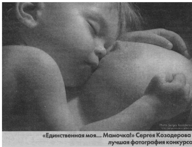
«Единственная моя... Мамочка!» Сергея Козодерова - лучшая фотография конкурса.